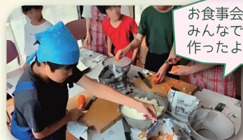
お食事会 みんなでカレーを 作ったよ