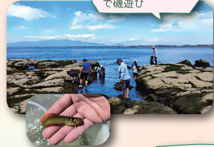
江の島・西浦漁港 で磯遊び