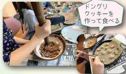
ドングリ クッキーを 作って食べる