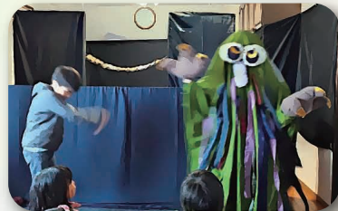
きんこんかんの 人形劇を観劇