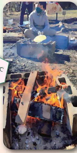
二宮の あそびの庭で たき火会