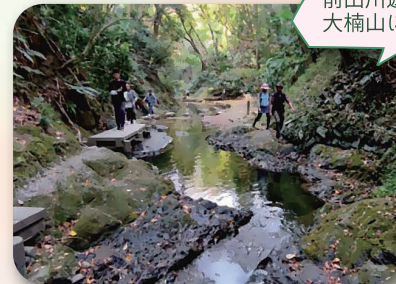
前田川遊歩道から 大楠山に登りました